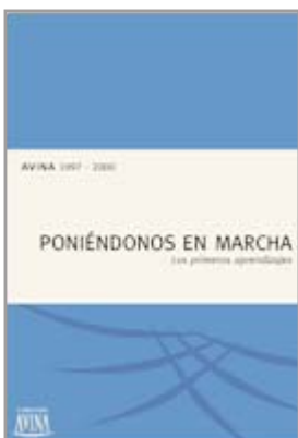
Pioneros (AVINA 1997 - 2000) Desenho, Edição e Distribuição mundial