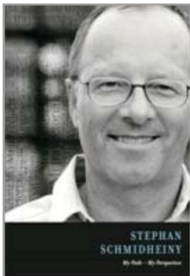
My Path - My Perspective Desenho, Edição e Distribuição mundial