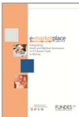
SECO e-marketplace Desenho, Edição e Distribuição mundial