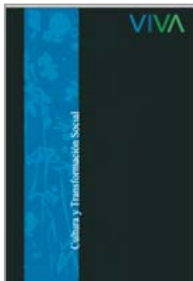
Cultura e Transformación Social Desenho, Edição e Distribuição mundial