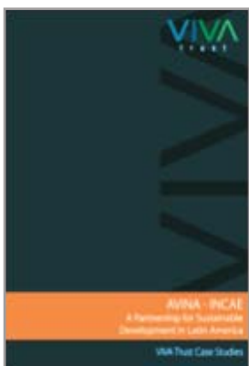
VIVA Trust Case Studies Desenho, Edição e Distribuição mundial