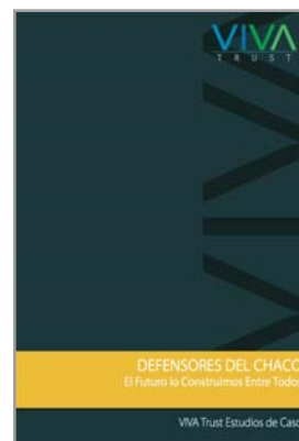
VIVA Trust Case Studies Desenho, Edição e Distribuição mundial