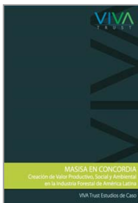
VIVA Trust Case Studies Desenho, Edição e Distribuição mundial